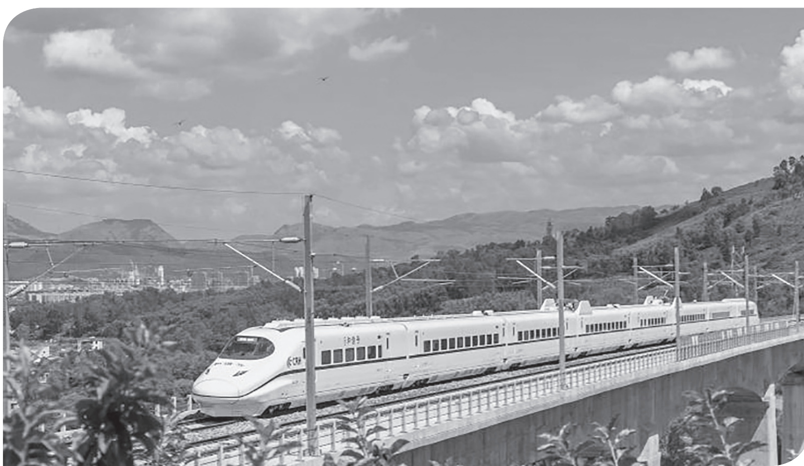
KERETA API BERKECEPATAN TINGGI

Foto yang diambil pada 23 Agustus 2022 menunjukkan kereta inspeksi komprehensif berjalan di jembatan besar kereta api berkecepatan tinggi Mile-Mengzi di Prefektur Otonomi Honghe Hani dan Yi, Provinsi Yunnan, Tiongkok. Kereta api yang mempuh perjalanan 107 km dengan kecepatan yang dirancang 250 kilometer per jam memulai uji coba baru-baru ini.